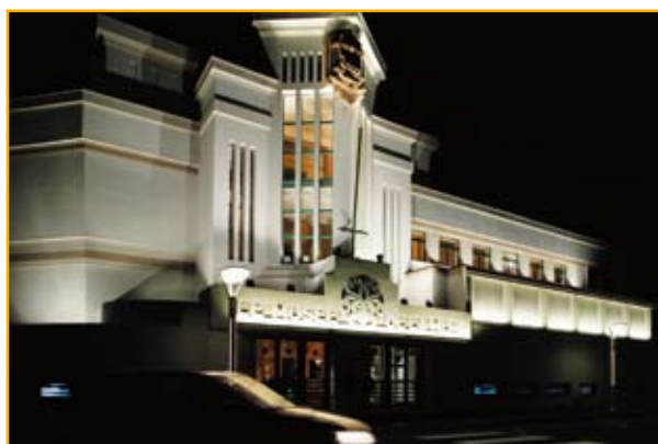
Le Musée de la mer

La Communauté d'Agglomération choisit d'opérer en priorité en amont en soutien à l'innovation ( centres de recherches, laboratoires ) et en aval pour faciliter l'implantation des entreprises ( aménager et mieux équiper pour accueillir les activités ), le tout en prenant résolument appui sur un développement ambieux des nouvelles technologies ( mise en place d'un réseau permettant l'accès au haut débit, implantation à Izarbel d'un centre de ressources numériques... ).