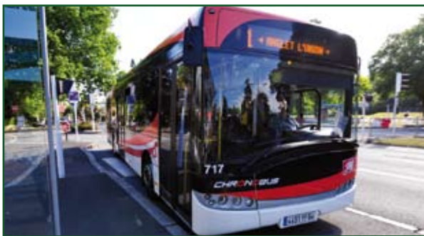
Chronobus de Bayonne

Une des conditions majeures pour réussir cette véritable mutation de la question « Transports-Déplacements-Mobilité » se trouve dans la définition commune entre l'Agglomération et le Département de l'interface, de l'articulation entre leurs deux réseaux, et ce pour l'offre de transport comme pour le partage de l'espace public. De la qualité de cette interface dépend une grande partie de la qualité et donc de la performance de l'offre de service aux usagers.