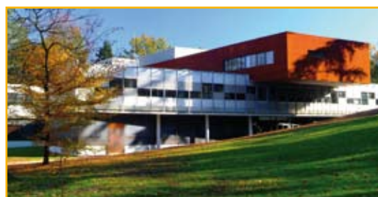
Campus de Montauray (UPPA)