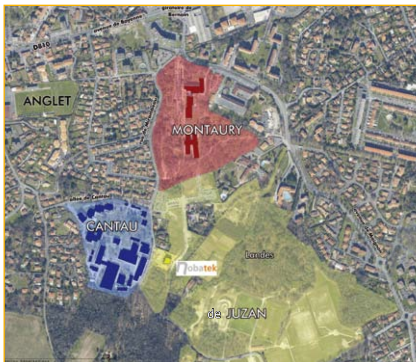
Les Landes de Juzan

Ce campus technopolitain s'inscrirait ainsi dans les thématiques récemment apparues autour de l'environnement et de l'énergie qui font des « Cleantechs » l'enjeu du développement économique futur des territoires ; d'autant que leur caractère transversal, qui fait appel aussi bien à l'électronique qu'aux biotechnologies ou à l'informatique, est de nature à renforcer les autres zones d'une Communauté élargie.